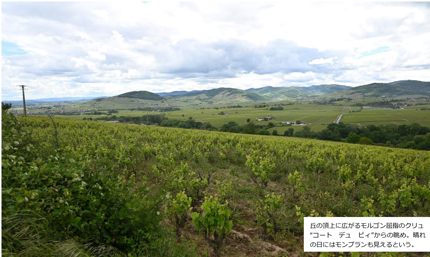
丘の頂上に広がるモルゴン屈指のクリュ “コート デュ ピィ”からの眺め。晴れ の日にはモンブランも見えるという。