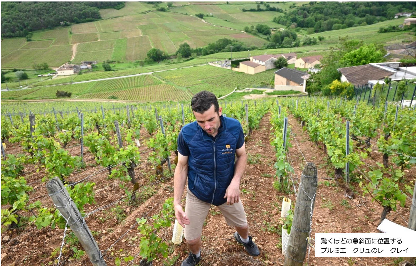
驚くほどの急斜面に位置する ブルミエ クリュのレ クレイ